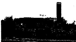
SOLDI L'impianto di Bertonico